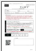
保証申込書 個人情報同意書