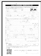
入居申込書 常口アトム専用