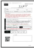
保証申込書 個人情報同意書