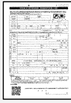
入居申込書 常口アトム専用