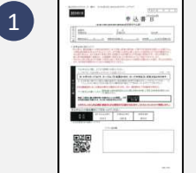
1 保証申込書 個人情報同意書