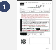
1 保証申込書 個人情報同意書