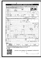
入居申込書 常口アトム専用