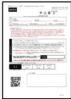
保証申込書 個人情報同意書