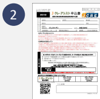
保証申込書 個人情報同意書